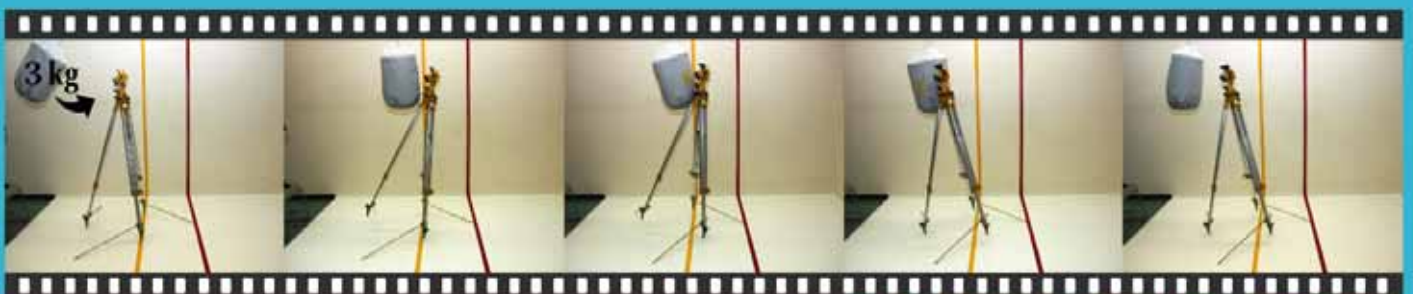
高さ 1m から重さ 3kg を振り落とした衝撃実験